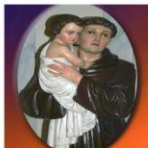
ASS. CULTURALE RELIGIOSA SANT'ANTONIO RIBERA