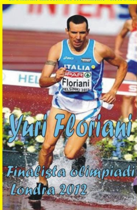
Yuri Floriani Finalista Olimpiadi Londra 2012