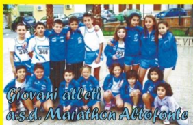
Giovani atleti a.s.d. Marathon Altofonte

da Palermo imboccare lo scorrimento veloce Palermo - Sciacca prima uscita a destra